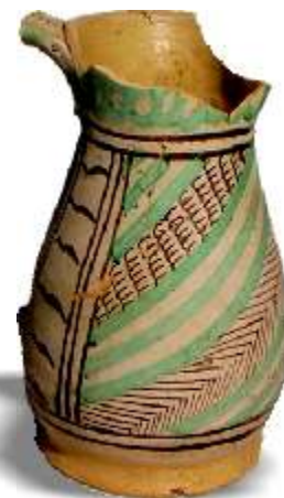
Età post-antica Boccale in maiolica arcaica dalle vasche di espansione Navile