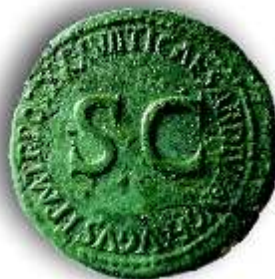
Età romana - Moneta dalle vasche di espansione Navile