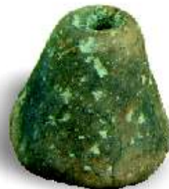
Età del Ferro - Fusaiola dalle vasche di espansione Navile

I rinvenimenti medioevali nel territorio di Bentivoglio